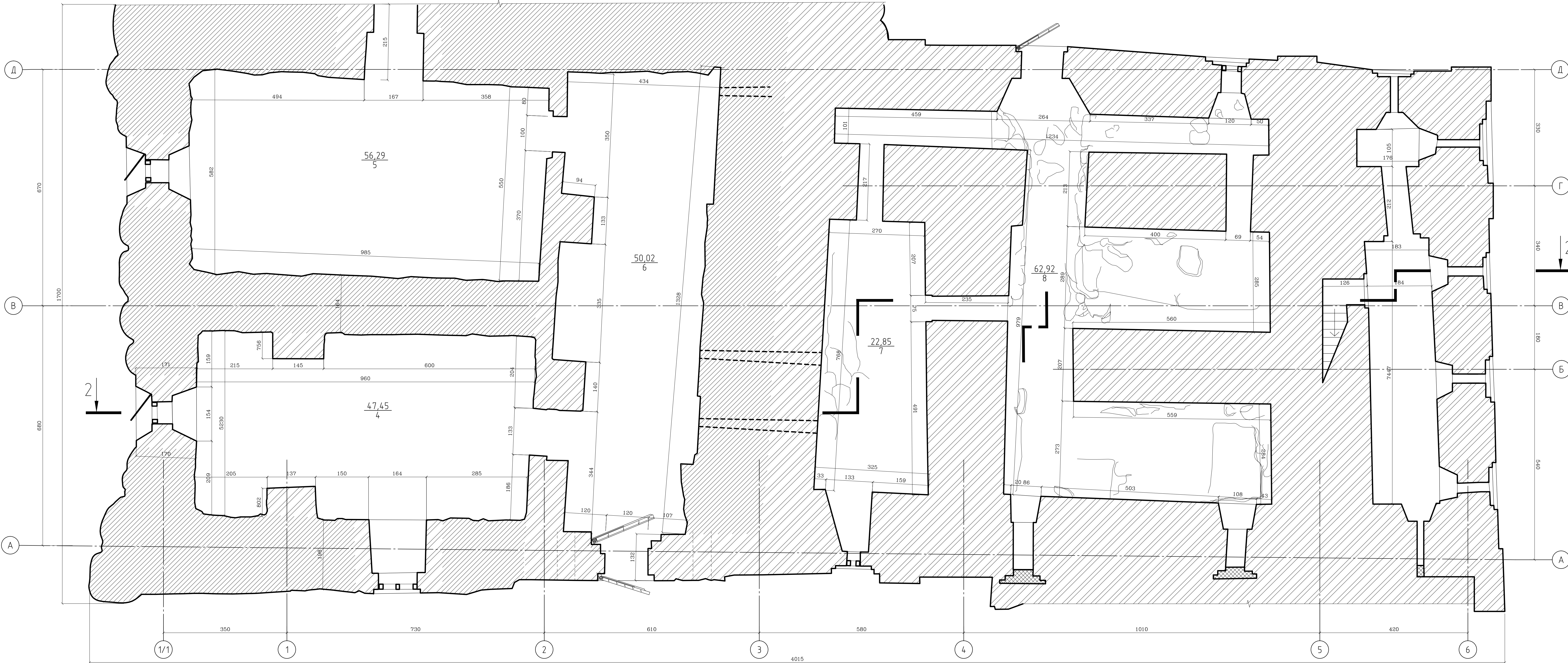
ЭКСПЛИКАЦИЯ ПОМЕЩЕНИЙ РИЗНИЦЫ